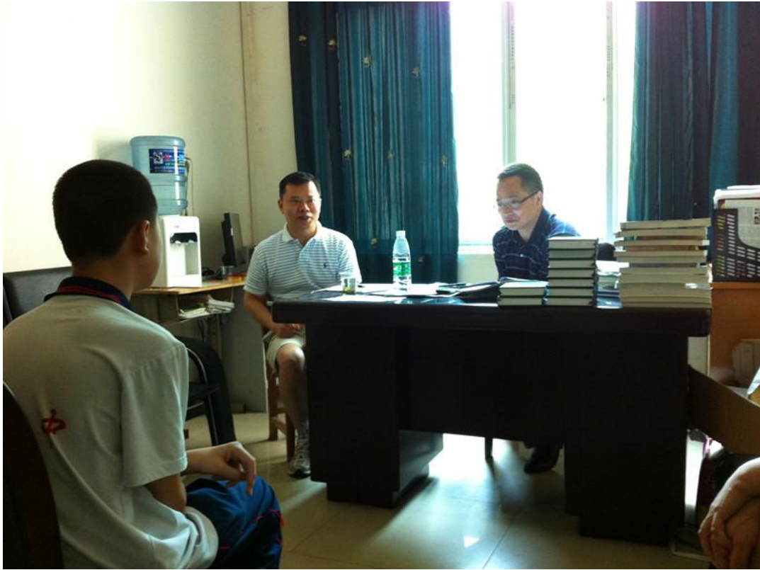
一对一的面试现场，两位爱心人士非常认真