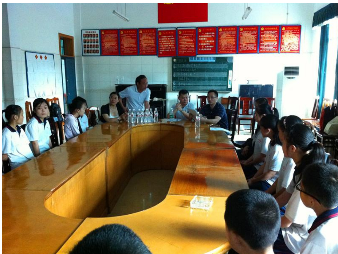
与学生们的见面会