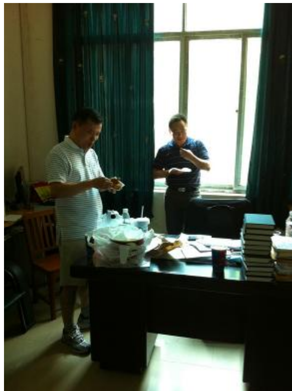
面试时间很紧，中餐又是草草以汉堡解决