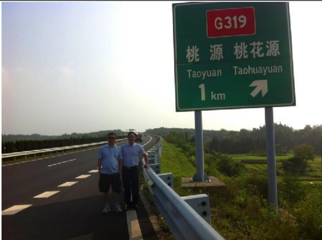
路经桃花源，没有时间游览，在路牌下留影也算是到此一游