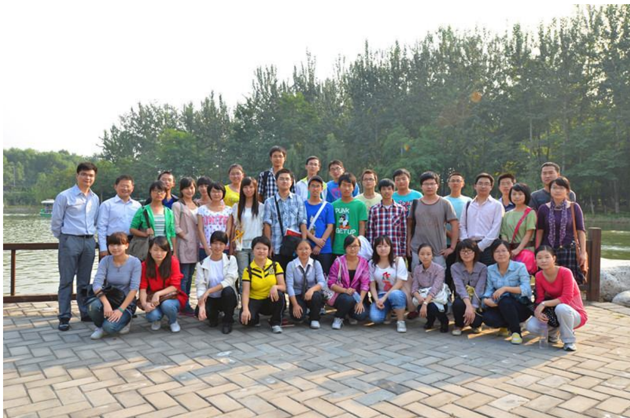
聚会奥林匹克森林公园