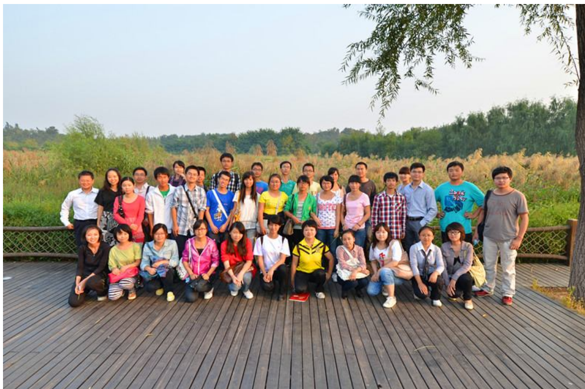
奥林匹克森林公园美丽的秋色