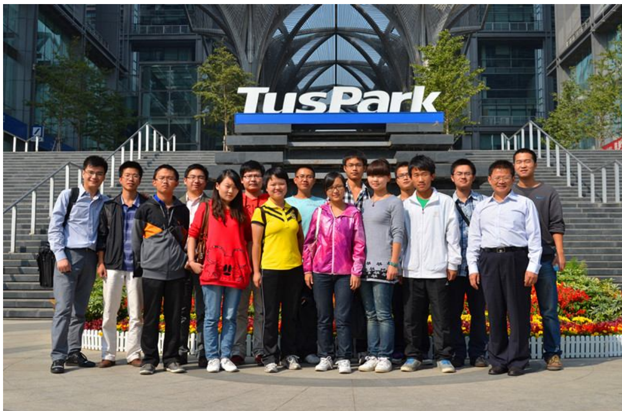
美丽的清华科技园，基金会北京办公室坐落于此