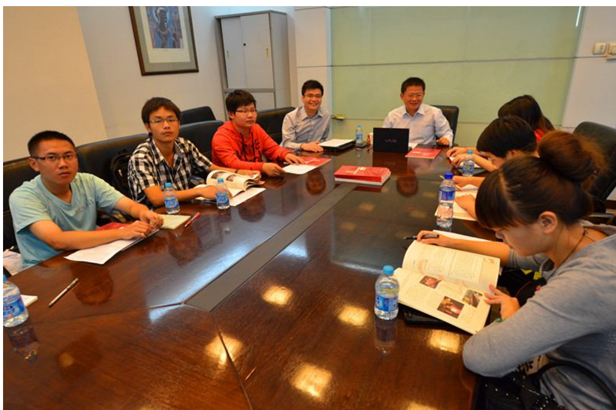
在基金会的北京办公室大家畅所欲言